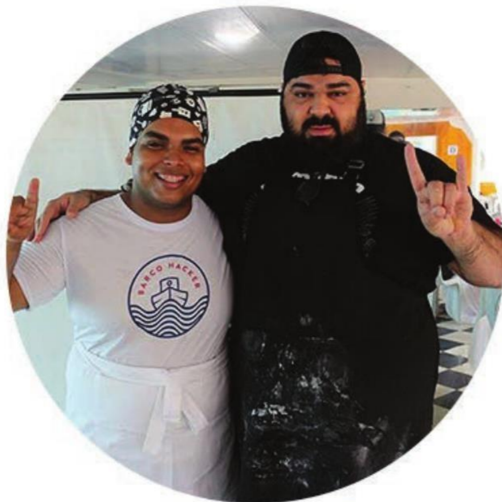
Chefes de Cozinha com a missão de criar novos pratos com os ingredientes coletados na ilha.